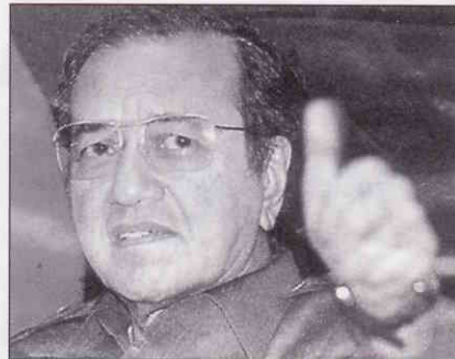
Dato Seri Dr. Mahathir Mohamad